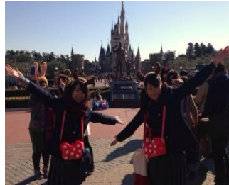
ディズニーランド