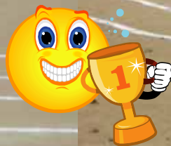
長 縄 と び