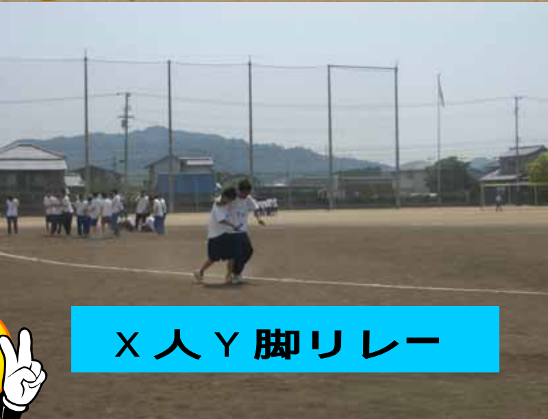
X 人 Y 脚 リレー