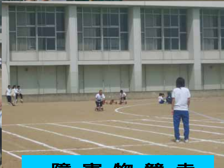
障 害 物 競 走