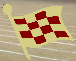
部活動対抗リレー