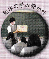
絵本の読み聞かせ

卒業後は、大学・短大・専門学校に進学して、栄養士や保育士、介護福祉士などへの道に進んだり、地域の生活産業などに貢献する人材として活躍したりします。