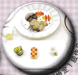
食物調理検定1級作品