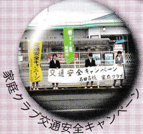
実習クラブ交通安全キャンペーン