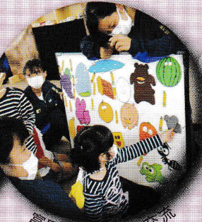
富田保育所との交流