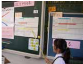
間接比較・任意単位（1年）