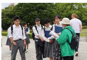
9人のガイドさんと 公園内を散策

・今回学んだことをふまえ、より多くの人に原爆の恐ろしさやそれがもたらす被害について、知ってもらう必要があると思いました。たった一つの原爆だけど、何十年にもわたって苦しみ続けなくてはいけない人々、生きたままで焼かれていった人々、家族や友人を奪われた人々等、多くの人が不幸になってしまったことを、しっかりと後世にも伝え、二度と繰り返さないようにしなければいけません。核兵器を製造したり、使用したりすることは絶対にやめるべきです。誰かが持っていたら、またヒロシマのような悲惨な出来事がどこかで起こる可能性があります。戦争している国があっても、原爆を落としてやろうと思わせないためにも、日本から原爆の悲惨さや苦しさをしっかりと伝え、世界の一人でも多くの人々に平和を望んでもらわなければならぬと思いました。