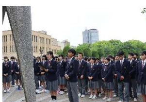
「原爆の子の像」のところで 平和集会