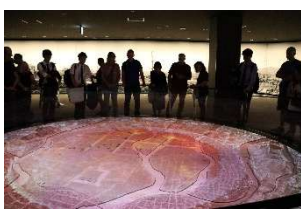
原爆投下前後が瞬時に 分かるプロジェクションマッピング