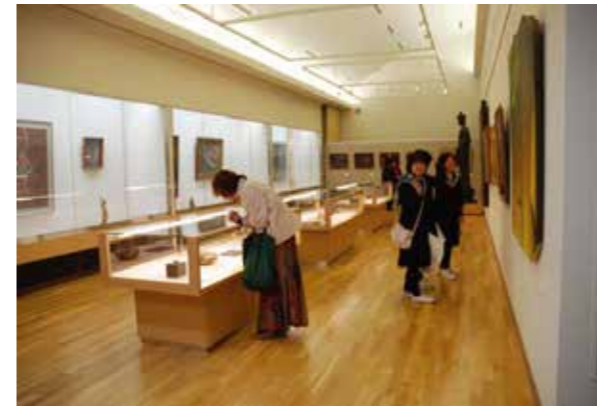
本館1階 工芸ギャラリー