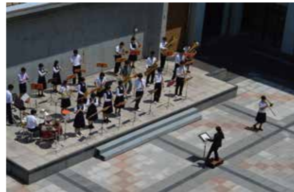
本館中央 オレンジスペース