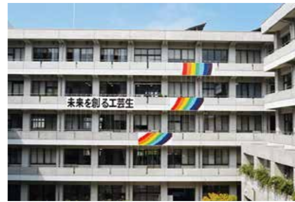
全校生で掲げたスローガン