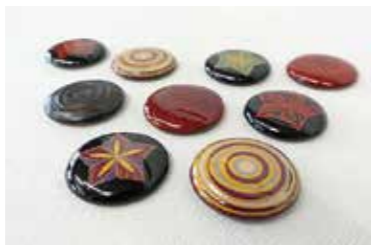
うるマグ缶 (漆マグネット)