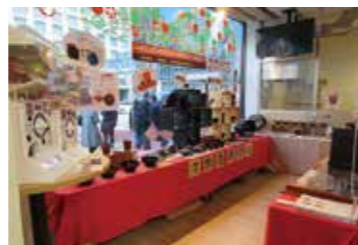
東京新橋 せとうち旬彩館でのPR販売