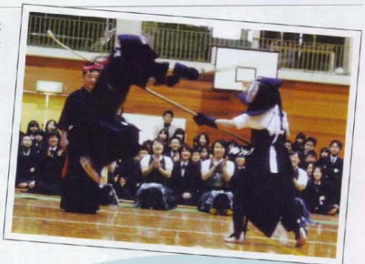
なぎなた VS 剣道異種武道大会 白熱する戦い