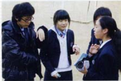
南漢高校の生徒との交流の様子