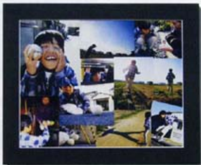
写真部 松尾佳奈さんの 最優秀賞作品 (全国大会出場)