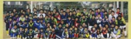
まんのう琴平地区の小・中・高 合同ミニサッカー大会 (2008年12月)