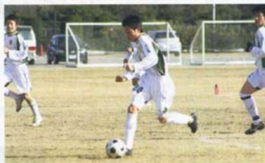
琴高サッカー部2種リーグ1部準優勝