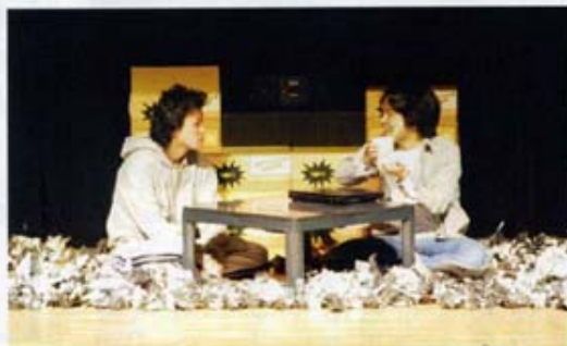
総合文化祭 優秀賞、舞台美術賞の演劇部