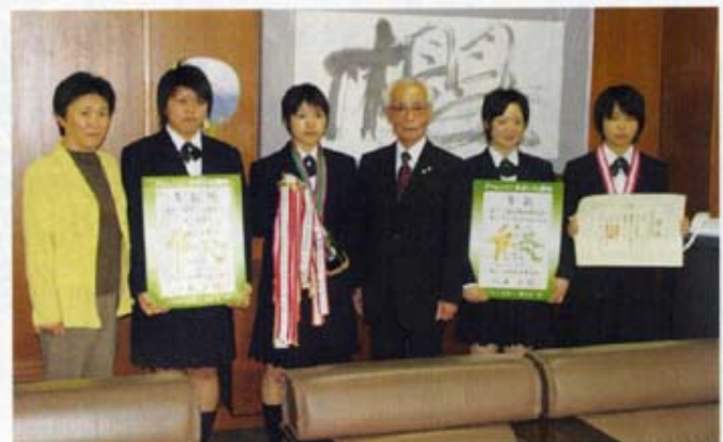
大分国体なぎなた競技総合準優勝の報告のため琴平町役場を表彰訪問