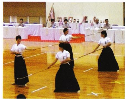
▲全国高校総体で、琴平高校同士の決勝

5月下旬から6月4日まで県高校総合体育大会が行われました。剣道部女子は、昨年度に引き続き団体が2年連続優勝と個人優勝、男子は、団体が準優勝を果たしました。また、なぎなた部は、30年連続37回目の団体優勝を果たし、個人演技・試合の部でも優勝を含め上位を独占しました。その他、弓道部、陸上部の生徒を含め4つの部が四国大会に出場することができました。さらに、なぎなた部は全国高校総体において、個人演技の部で優勝・準優勝という素晴らしい成績を取め、全国に琴平高校の名を轟かせてくれました。