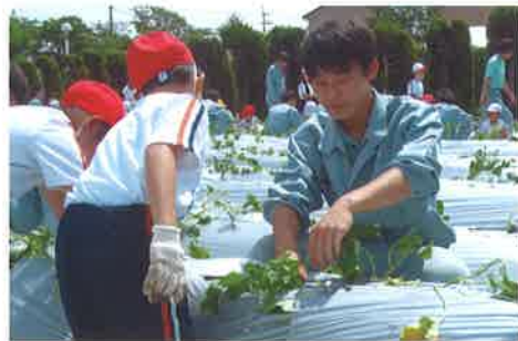
小学生との交流行事：6月