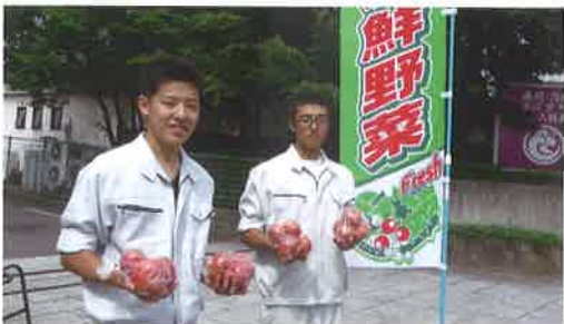
▲環境科学科「総合実習」