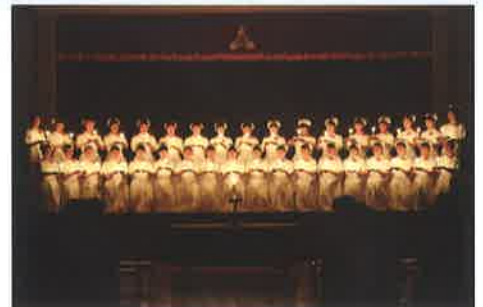
看護科の戴帽式：5月