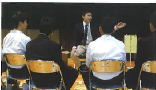
▲普通科「総合的な学習（進路ガイダンス）」