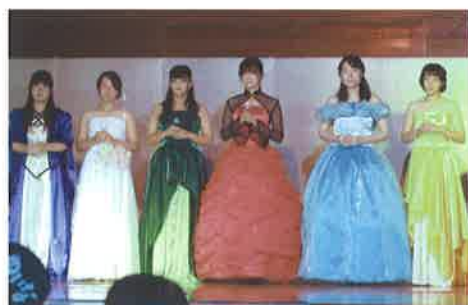
コスチュームショー：9月