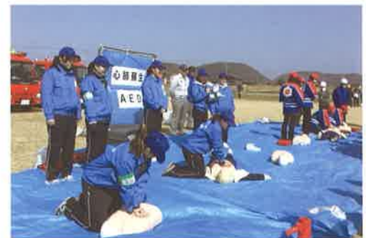
「専攻科地区活動（一宮地区防災訓練）」