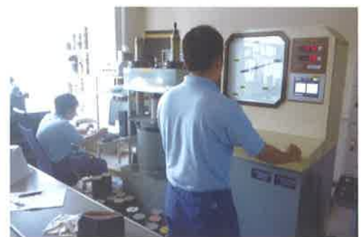
「総合実習コンクリート圧縮試験」