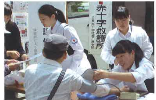
「地域活動（赤十字フェスタ）」