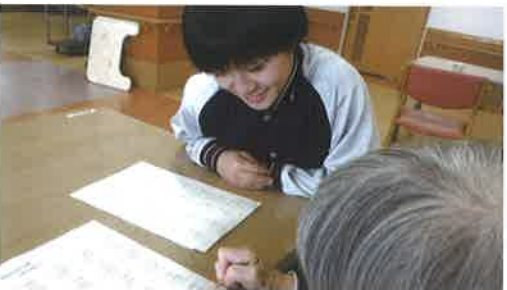
▲福祉科「介護実習（アクティビティ）」