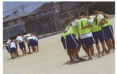
クラスマッチ：7月・12月