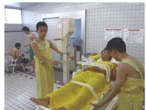
「生活支援技術（入浴介助）」

福祉系大学及び医療系・保育系・リハビリテーション系等の短大・専門学校への進学、公務員及び特別養護老人ホーム、介護老人保健施設や障害者施設等への就職