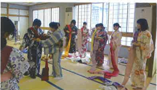
▲生活デザイン科「着付け講習会」