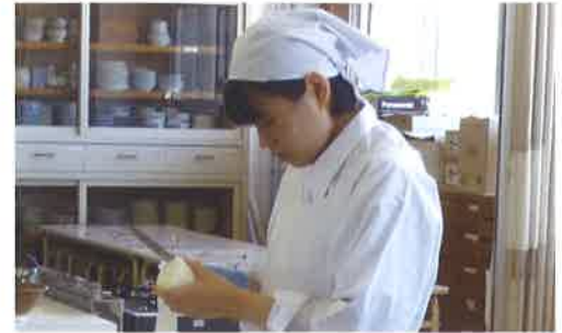
「食物調理技術検定」