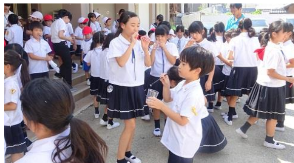
割れないシャボン玉

たまごのおふとん、ゆらゆらパンダ、ころころパンダなどの、絵本に興味津々。お兄さんのパペットの動きがおもしろい！