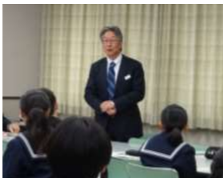
高校教育課課長補佐より講評

2年生は、この後もグループ研究を続け、春休みには香川大学に出向き教授からアドバイスを受け、研究を深める予定です。最終発表は、3年次の4月に行います。