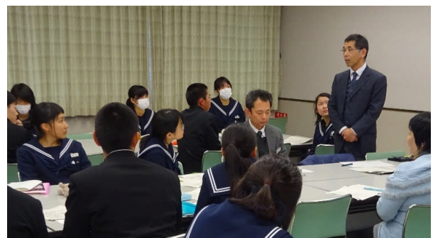
教頭、高校教育課主任指導主事より講評