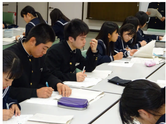
他グループの発表内容をメモ、評価