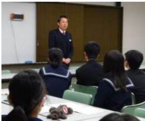
高校教育課主任指導主事より講評

2年生は、この後もグループ研究を続け、春休みには香川大学に出向き教授からアドバイスを受け、研究を深める予定です。最終発表は、3年生の4月に行います。