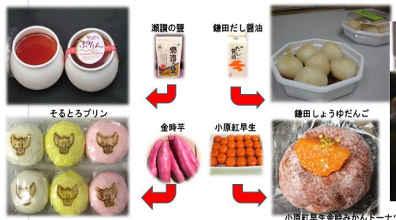
地元産品を利用した商品開発の一例