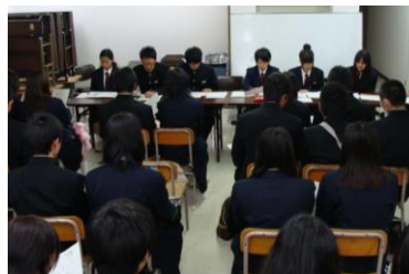
店舗マネージャー会