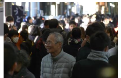
当日の商店街のようす