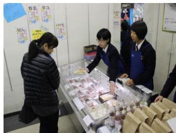
水産物販売のようす

これらの取組みを通して、学校の垣根を超え、人と人をつないで連携を図り、障がいのある方にも生きがいとやりがいを感じとってもらえるイベントとなるように、地域とともに生きる坂出商業高校として、新しい令和の「セキレ」が動き出すことを目指していきたいと思えます。