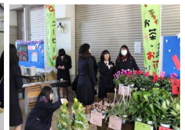
農産物販売のようす