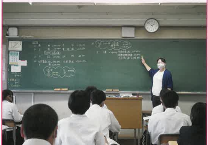
上級資格取得をめざし、徹底して行われる簿記の授業