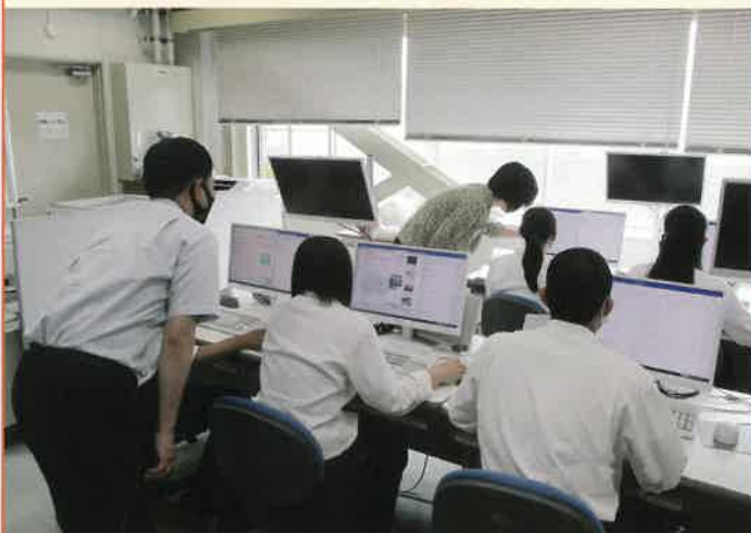
複数の教員(TT)によるきめ細やかなパソコンの実践的授業