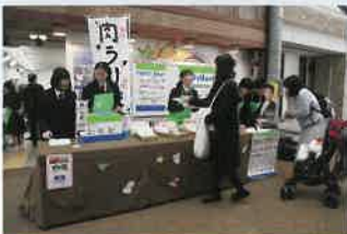
坂商フェア「セキレ」(12月)