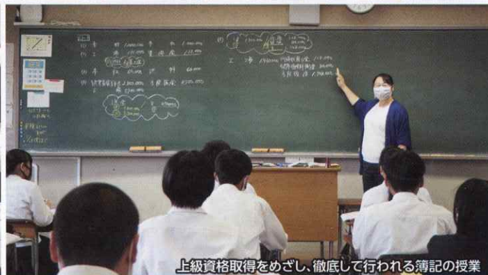
上級資格取得をめざし、徹底して行われる簿記の授業

上記の他にも、興味関心に応じて以下のような資格・検定にも先輩方は積極的にチャレンジしています!