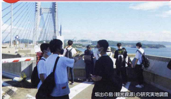
坂出の島(観光資源)の研究実地調査