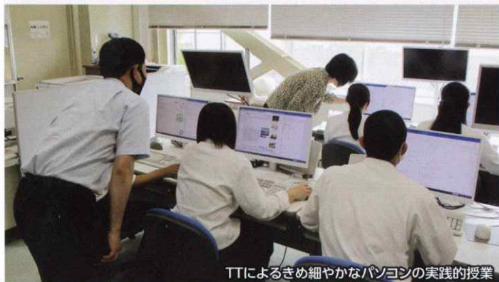
ITによるきめ細やかなパソコンの実践的授業