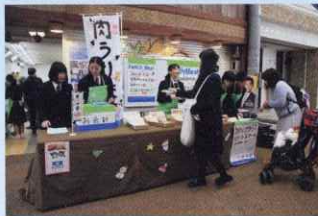
坂商フェア「セキレ」(12月)