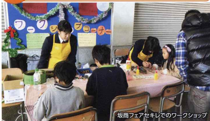
坂商フェアセキレでのワークショップ

簿記(全商・日商)、全商英語、情報処理、珠算・電卓、ビジネス文書、商業経済、会計実務など