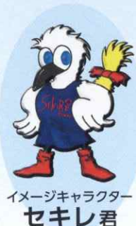
イメージキャラクター セキレ君

坂商フェア「セキレ」は、商業高校という本校の特性を生かした販売実習です。2009年に会場を坂出商店街に移して以降、今や坂出の冬の風物詩としてすっかり市民に定着しています。坂商生が開発したオリジナル商品のクラス店舗での販売や、商店街・大学・県内外の高校などとのコラボレーション、イベント会場でのステージ披露、イオン坂出店1階における文化部展の開催など、盛りだくさんの坂商最大のイベントとなっています。マスコット「セキレ君」の着ぐるみも好評です。