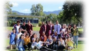
オーストラリア語学研修

2年次より「文系コース」「国際コース」「理系コース」3つのコースを設定しています。「国際コース」は実践的な英語力を伸ばすために通常の英語授業以外に多くの英語授業を設定し、オーストラリアでの語学研修(ホームステイ)を実施しています。