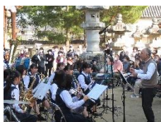
吹奏楽部・地域イベントに参加