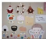
「三高みんなの食堂プロジェクト」