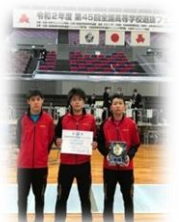
全国選抜フェンシング大会 団体3位