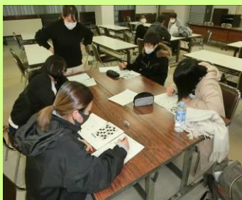
学力定着度をはかる取り組みを、 全学年合同で行っています。