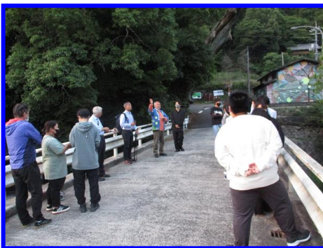
▲地域ボランティアより説明

事前に地域ボランティアの方からホタルについての説明があり、生徒たちは暗闇の中でふわふわと飛びながら光るホタルに夢中で見入っていました。今回の訪問は、日頃の疲れた心と体を癒してくれる、良い機会となりました。