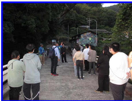
▲生徒からの質問タイム