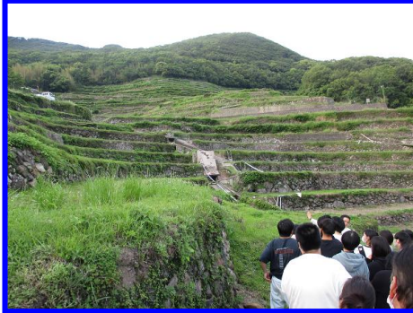
▲地域おこし協力隊より説明