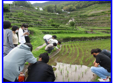
▲地域おこし協力隊より説明