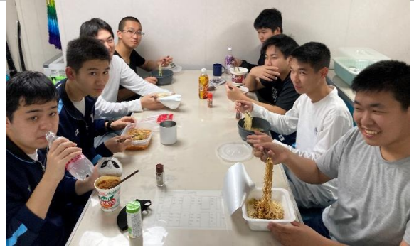
船酔いから回復し、みんなで夜食