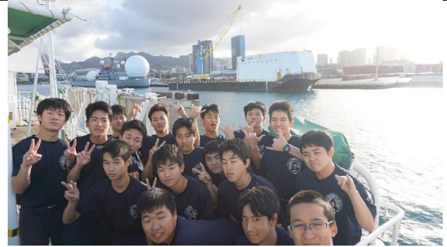
入港前の集合写真