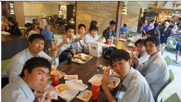
ロイヤル・ハワイアン・センターにて食事

この日も、昼過ぎまでワイキキにて研修を行いました。班別に分かれ、事前に立てた行動計画に従いながら観光や食事、買い物などを行い、その後は全員バスでホールフーズマーケット（食料品スーパー）に行きました。日本とは全く異なる環境で、実習生たちだけで協力し、行動することで多くのことを学ぶことができました。