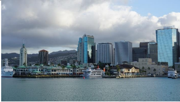
船から見るホノルルの街

ワイキキにて円からドルへの換金を行い、その後ワイキキにて班別研修を行いました。初めて海外の地に足を踏み入れ、バス移動や換金、食事や買い物など初めて尽くしのことばかりで戸惑うことが多く、現地の人と英語でコミュニケーションを取ることがいかに難しいかを実感しました。