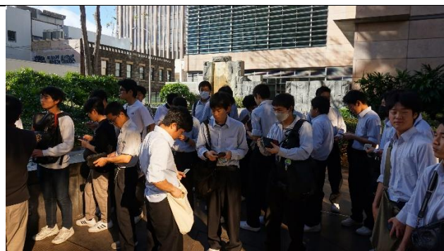
バス待ちの間にバス代の準備