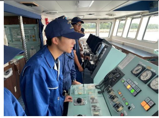
船の速度を調整しています。