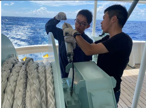
係船機のグリスアップをしています。