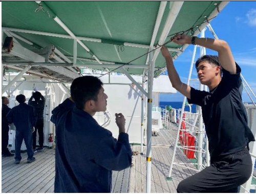
乗組員さんからロープワークを教わっています。