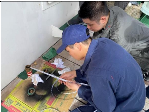
燃料を積込んだタンクの計測をしています。