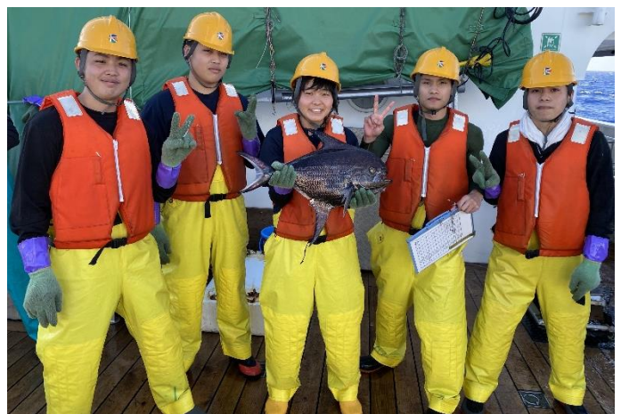
ビックスケールボンフレット