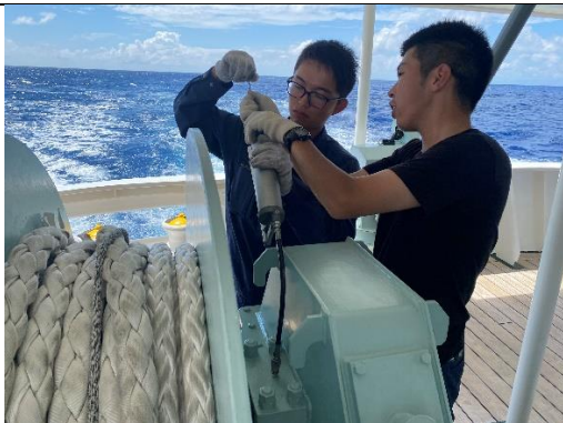
係船機のグリスアップをしています。