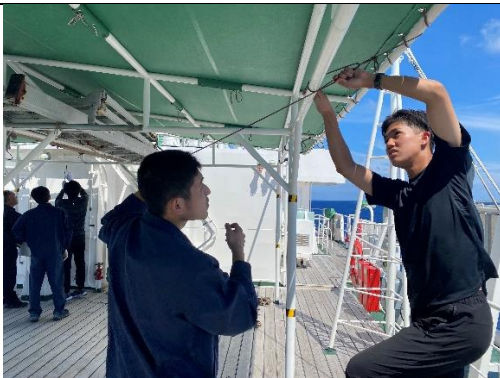
乗組員さんからロープワークを教わっています。