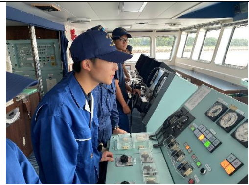
船の速度を調整しています。