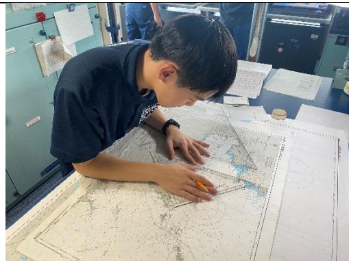
海図に船の位置を記入しています。