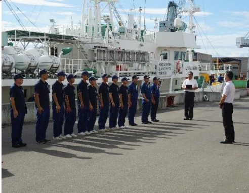
丸亀港にて出港式を行いました。

さて、いよいよ翔洋丸は漁場をめざして太平洋へ出港します。残り約60日でどれだけ成長していくか楽しみです。