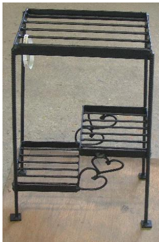
フラワースタンドの製作