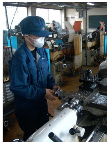
旋盤技術・技能を活用してロボット部品の製作