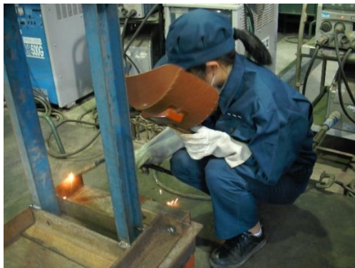
溶接技術・技能を活用してアイデア作品製作