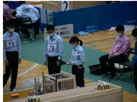
第30回全国高等学校ロボット競技大会（青森大会） 本年度は、3年機械科の課題研究班が出場し32位となった。