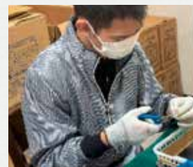
部品のバリ取り作業