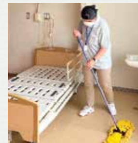
老人介護施設での実習 (フロア清掃)