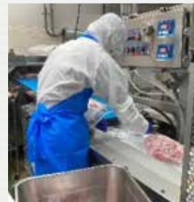
食品加工会社での実習 (肉の真空包装)