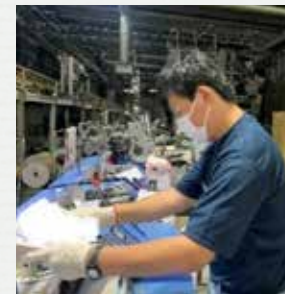
印刷会社での実習 (製本作業)