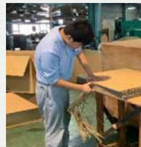
ダンボール会社での実習 (バリ取り作業)